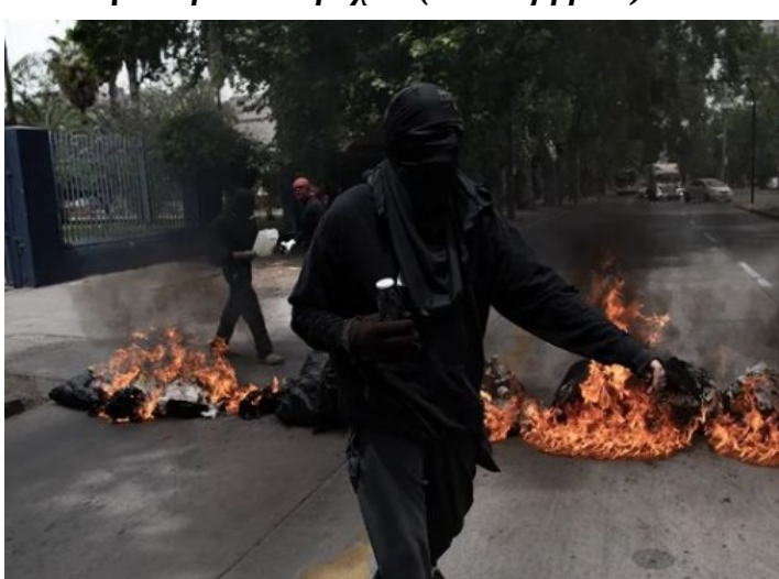
UMCE / πρώην Παιδαγωγική (21 Νοεμβρίου)