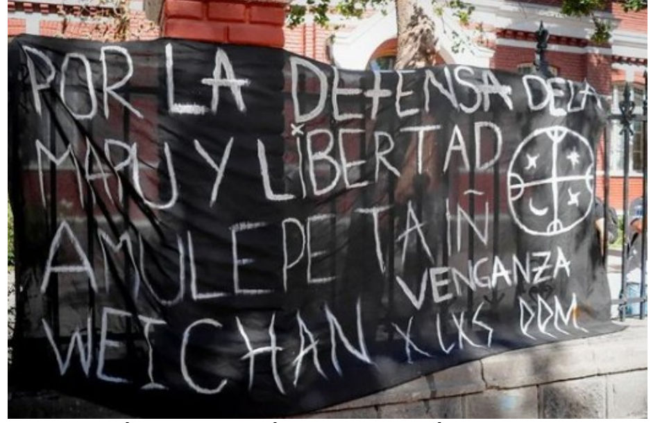
«Για την υπεράσπιση των Μαπούτσε και της ελευθερίας. Amulepe taii weichan.» (Αυτή η φράση είναι ένα σύνθημα του αδάμαστου και επαναστατικού λαού των Μαπούτσε και σημαίνει «Ο αγώνας μας συνεχίζεται». Στις μέρες μας εκφράζεται ενάντια στην Χιλιανή αποικιοκρατία που πουλάει την γη τους στους καπιταλιστές για την λεηλασία της φύσης στον βωμό του κέρδους)

La Portada, το Constanera Center, η CCU, λίγα μέτρα από την πρεσβεία των ΗΠΑ, μεταξύ άλλων. Επιπλέον, το Sanhattan χαρακτηρίζεται από το γεγονός ότι τα περισσότερα από τα κτίριά του αποτελούν χώρους συνεδριάσεων για ιδιοκτήτες τραπεζών, ορυχείων, κατασκευαστικών εταιριών, υδροηλεκτρικών εργοστασίων, βιομηχανιών πετρελαίου, δικηγορικών γραφείων, ιδιωτικών υπηρεσιών ασφαλείας, κ.λπ. Είναι το μέρος όπου διαχειρίζονται οι τρόποι με τους οποίους ζει και πεθαίνει ο κόσμος, όπου η πολιτική θανάτου έχει λόγο ύπαρξης, όπου οι καπιταλιστικές και αυταρχικές προσδοκίες ενισχύουν ένα σημαντικό μέρος των υπερεθνικών παρεμβατικών δυνάμεών τους.