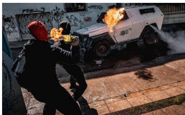
Liceo de aplicación (3 Νοεμβρίου)