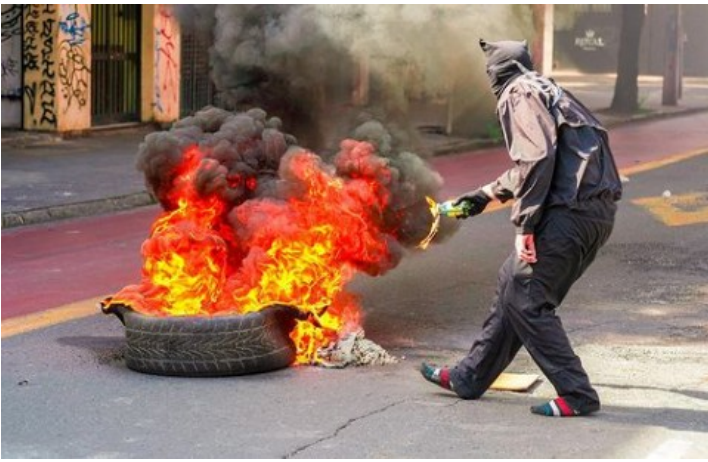
Liceo Manuel Barros Borgoño (2 Νοεμβρίου)