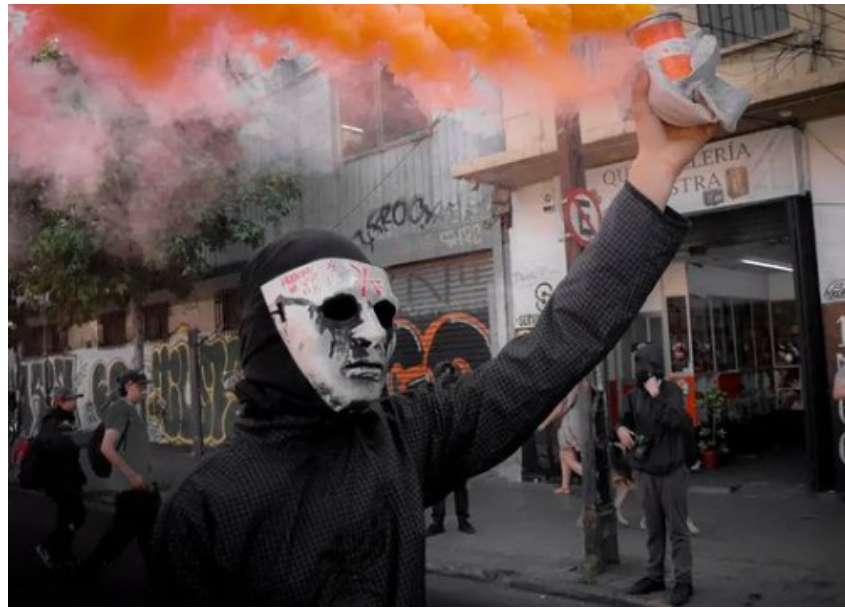
Liceo Manuel Barros Borgoño, Σαντιάγο. Ταραχές εις μνήμην του αναρχικού Sebastián Oversluij

«Ως αναρχικοί αρνούμαστε να ικετεύσουμε τους άρχοντες του πολέμου για κατάπαυση του πυρός. Αναλάβετε να σαμποτάρουμε την ικανότητα του Ισραήλ να διαπράττει γενοκτονία, σαμποτάροντας τη ροή κεφαλαίου στις ΗΠΑ, και έτσι τον μηχανισμό για τον πόλεμο στο εξωτερικό [...] Το λεγόμενο κράτος του Ισραήλ απαιτεί την ομαλή ροή