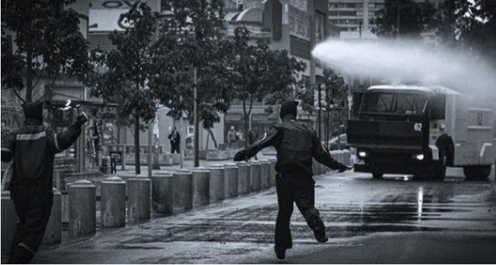
Instituto Nacional (2 Νοεμβρίου)